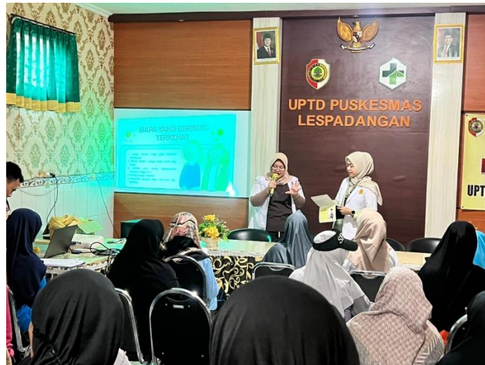
Gambar 3.2 Penyampaian materi penyuluhan GEMAS (Gerakan Sehat Atasi Asam Urat)