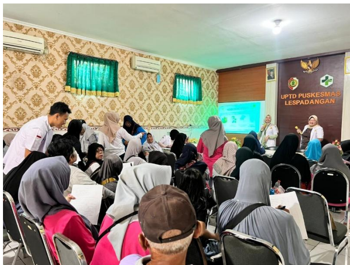
Gambar 3.1 Pembagian dan pengisian kuesioner sebelum penyuluhan