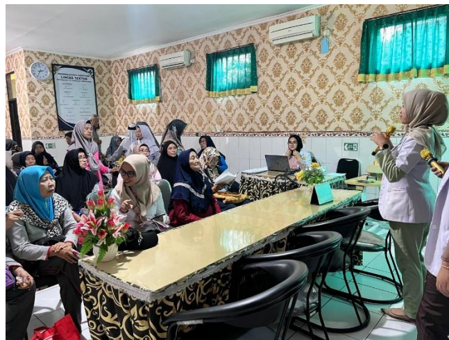
Gambar 3.3 Sesi diskusi dan tanya jawab kepada peserta penyuluhan